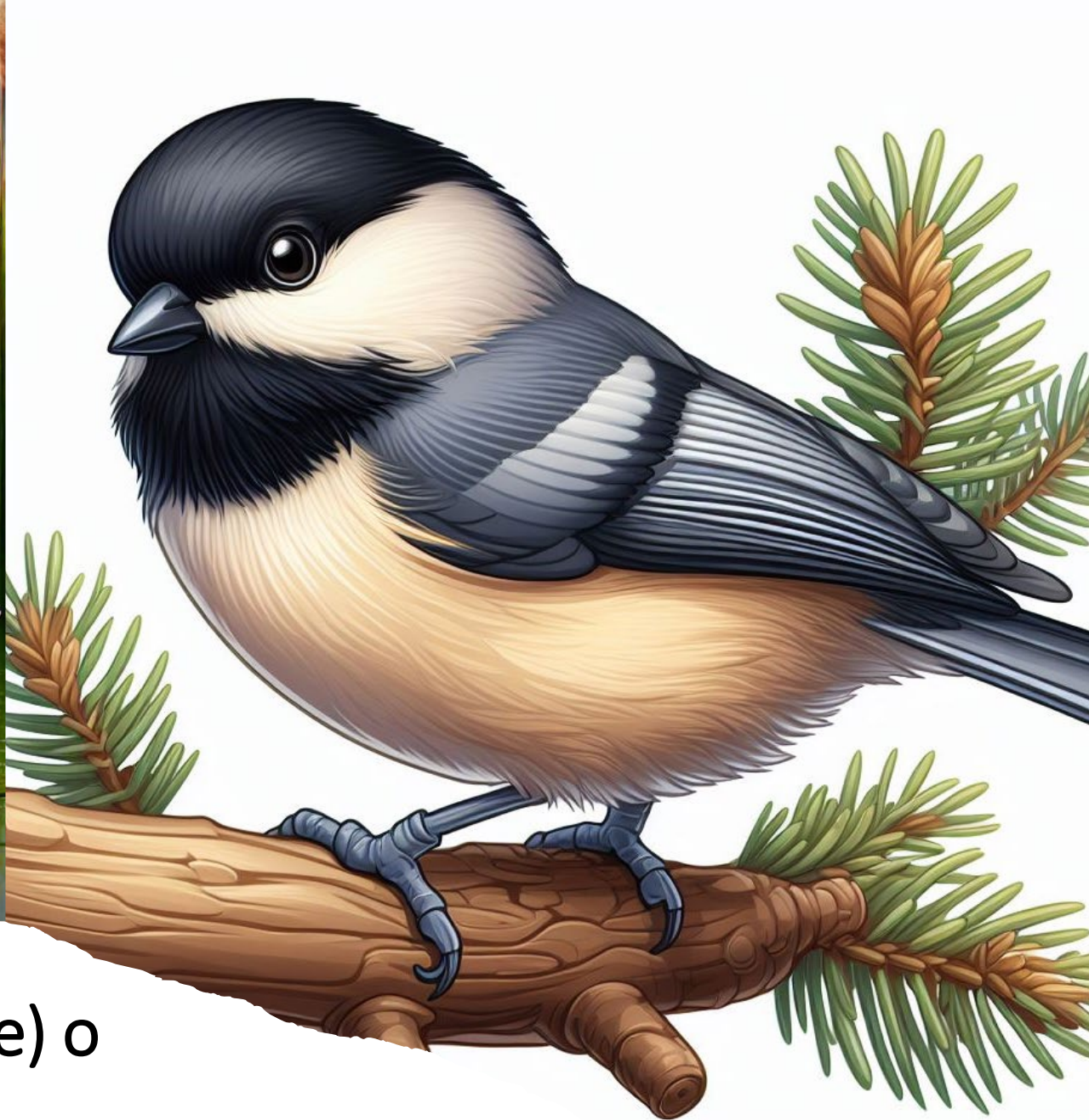
Pueden ser grandes (como este cisne) o pequeños (como este carbonero).